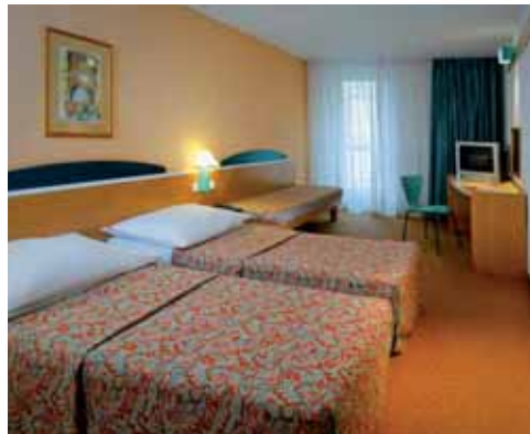
Prix par personne hôtel Ibis Karlin :