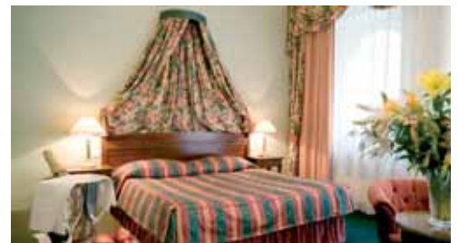
Prix par personne hôtel Liberty :

(- de 12 ans, partageant la chambre avec 2 adultes)